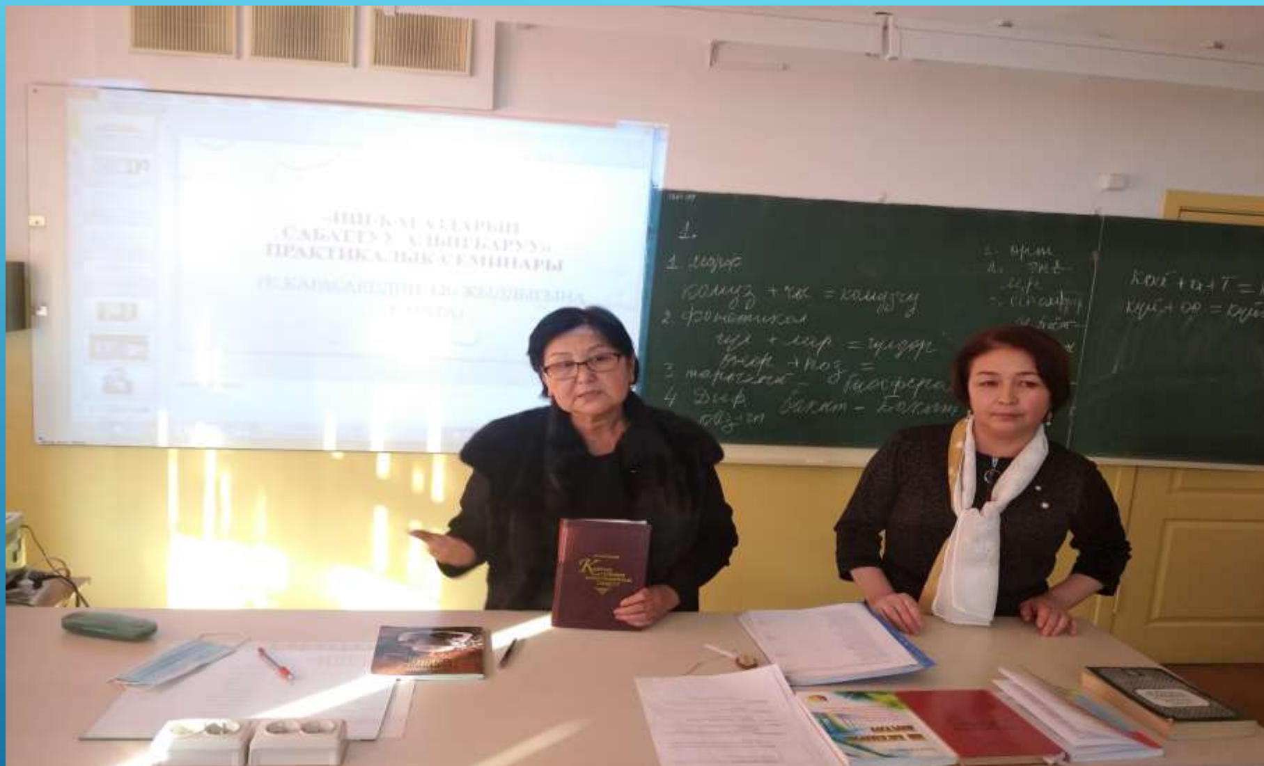
ЖАШ МУГАЛИМДЕР СУРООЛОРУНА ЖООП АЛА АЛЫШТЫ